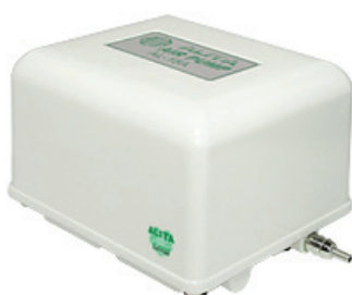
Modely na tlak a vákuum AL-6SA, AL-15SA, AL-30MSA